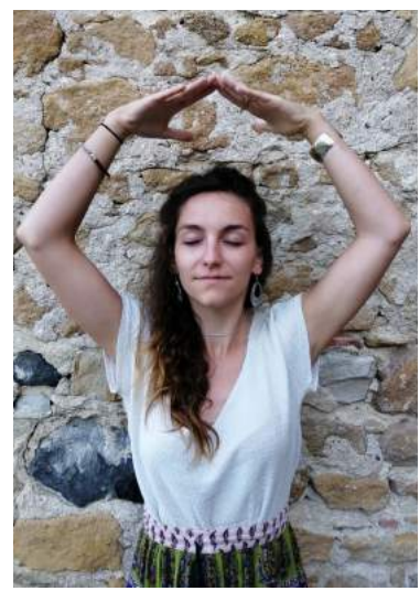
Jouer des maracas