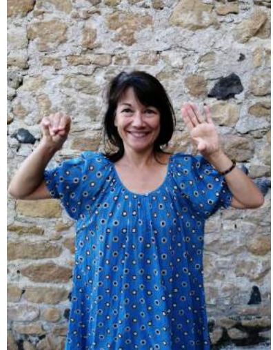
Murmures (alterner mains ouvertes et fermées)